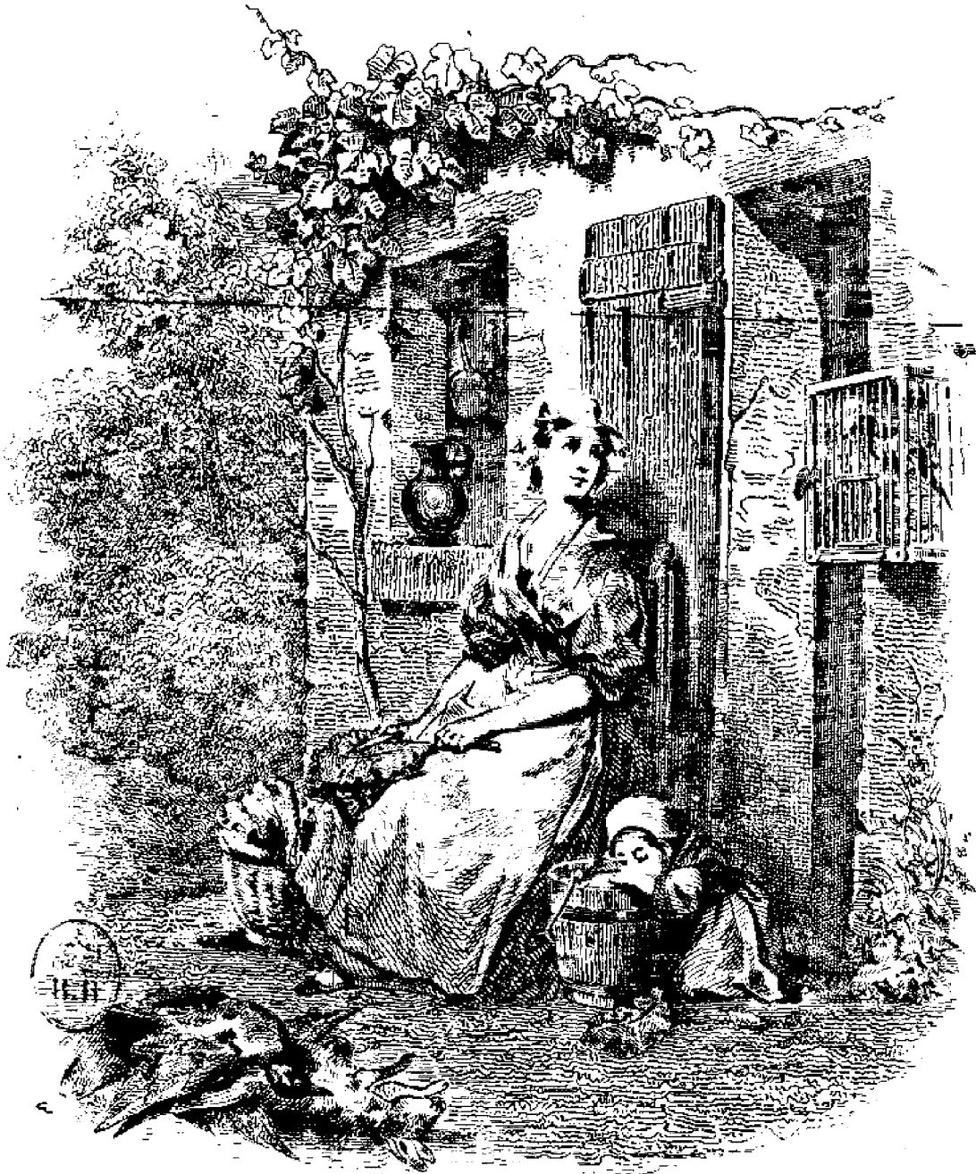
Planche extraite des Classiques de la Table en Fol. in 8. avec illustrations. 2 e Edition.